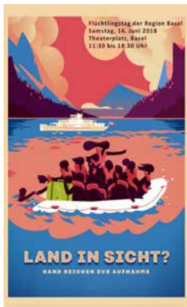
Der aktuelle Flyer.

Papst Franziskus schreibt in der Botschaft zum 104. Welttag des Migranten und Flüchtlings 2018: «Der Herr vertraut der mütterlichen Liebe der Kirche jeden Menschen an, der gezwungen ist, die eigene Heimat zu verlassen. Diese Fürsorge muss konkreten Ausdruck in jedem Abschnitt der Erfahrung der Flüchtlinge finden ... Diesbezüglich möchte ich erneut bekräftigen, dass man unsere gemeinsame Antwort in vier Verben gemäss den Grundsätzen der Lehre der Kirche aufgliedern könnte: aufnehmen, schützen, fördern und integrieren.»