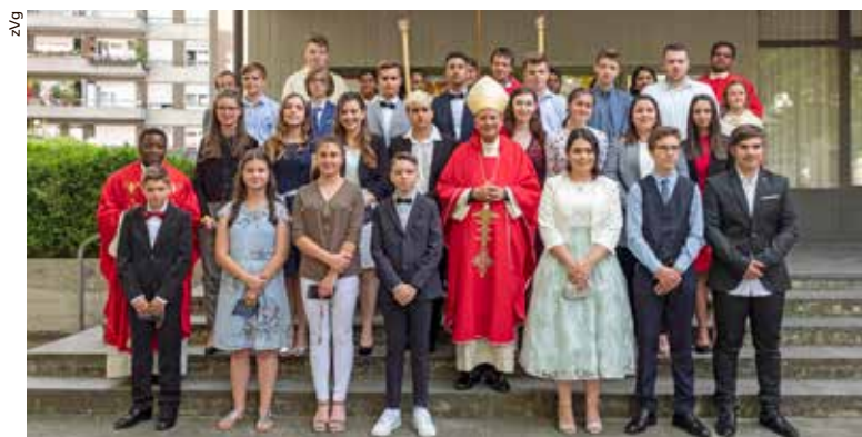
Firmung St. Anton.

zung der Revision einstimmig angepasst und anschliessend eine anerkannte Revisionsstelle einstimmig gewählt. Die Verwendung des Kilbierlöses 2018 wird nach Beschluss der Versammlung dem Karmeliterkloster Elias in Basel zugute kommen. Nach Informationen zum aktuellen Stand der Orgelrestauration und noch einigen Gedanken zur Eröffnung des Pastoralraumes Basel-Stadt am 9. Juni wurde die Versammlung offiziell geschlossen, und alle waren eingeladen zu einem kleinen Imbiss und Gedankenaustausch.