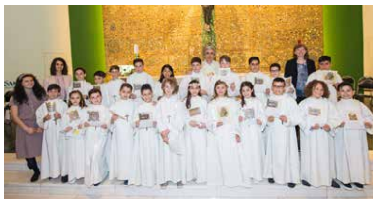
Erstkommunion San Pio X.